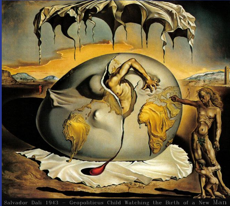
Salvador Dalí 1943 – Geopoliticus Child Watching the Birth of a New Man